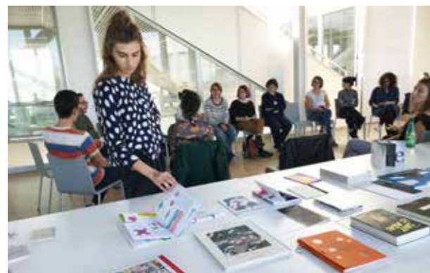
Booklab #1, présentation des ouvrages par les étudiants

Depuis la rentrée, la BAeT et l'ésam Caen/Cherbourg proposent au public un rendez-vous régulier. Cet atelier ouvert à tous permet de suivre l'évolution d'un ouvrage, de son écriture à son édition, et de dialoguer avec son auteur, étudiant en 4 e année option Design mention Éditions (il n'est pas indispensable d'avoir suivi les premiers ateliers pour s'inscrire au suivant).