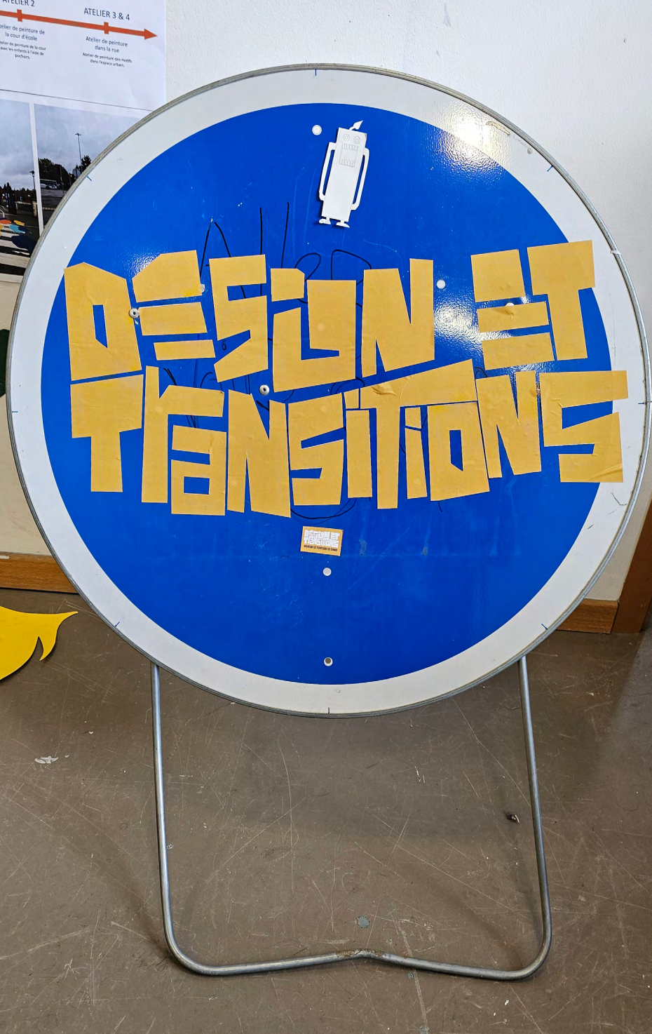
Accrochage des étudiant·es du double-diplôme Design & Transitions pour les Portes ouvertes 2024 février 2024