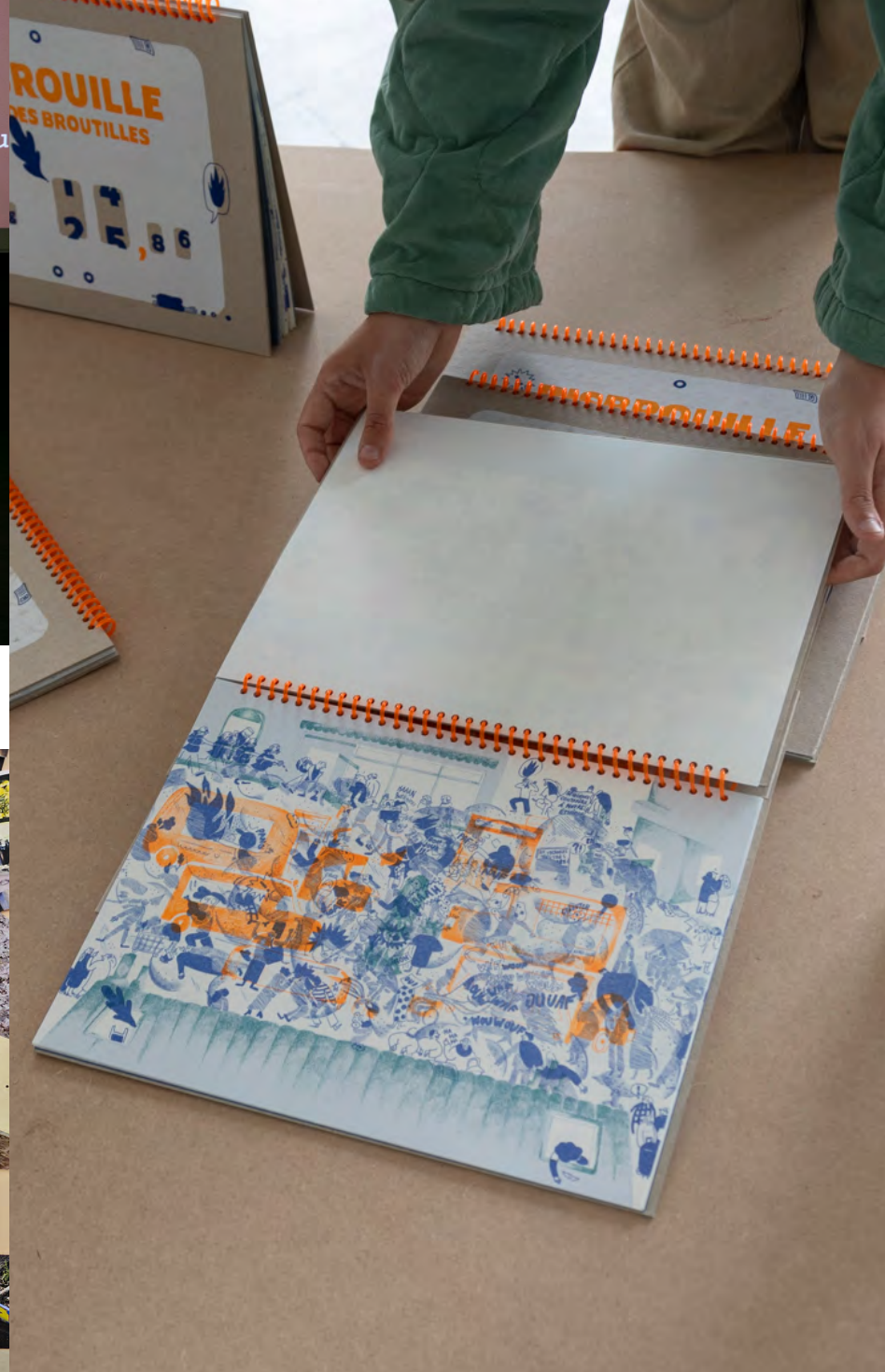
Zoé Gomont DNSEP option Design mention Éditions juin 2023