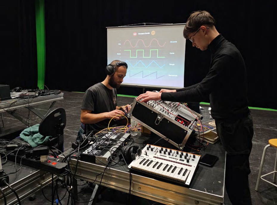
Workshop inter-années Patch & Tweaks studio modulaire septembre 2023