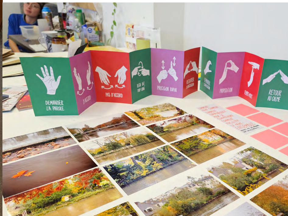
Accrochage des étudiant·es du double-diplôme Design & Transitions pour les Portes ouvertes 2024 février 2024