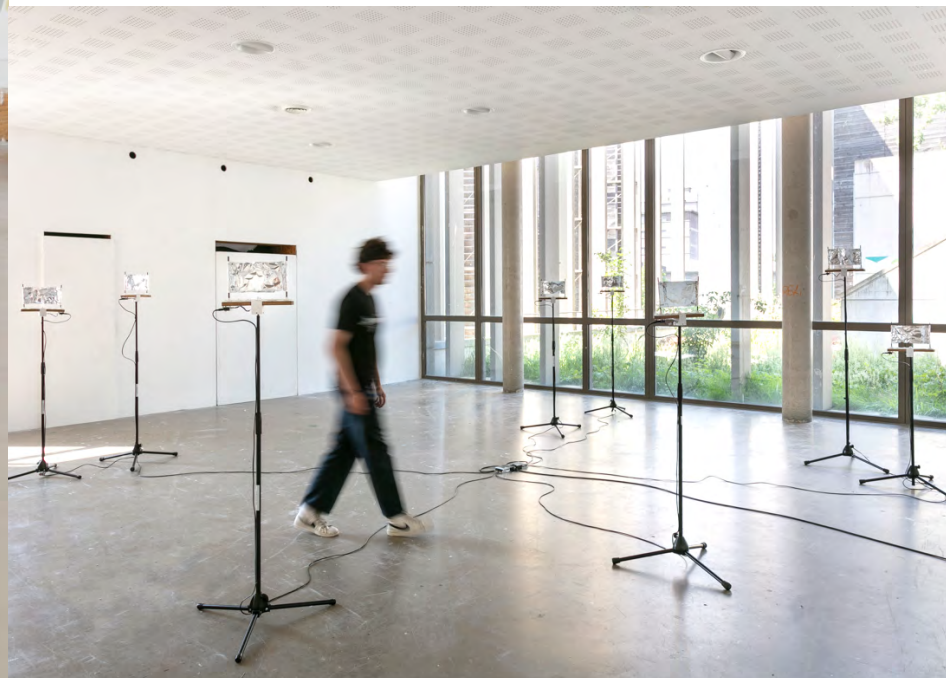
Simon Barette DNSEP option Art mention Art juin 2023