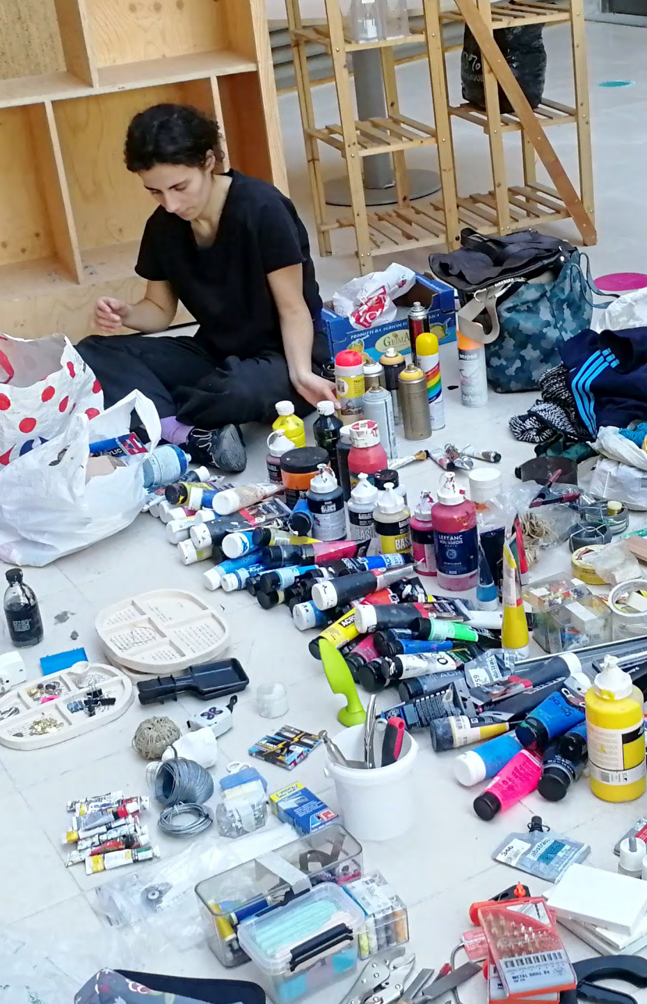
Workshop inter-années Récupérathèque (avec la Fédération Des Récupérathèques) janvier 2024

Lors de leurs deux ou trois années de formation au sein de l'ésam Caen/Cherbourg, les étudiant-es du DNSEP option Art mention Art, du DNSEP option Design mention Éditions et du double diplôme Design & Transitions participent à des dispositifs pédagogiques et culturels communs et bénéficient des apports de nombreux·euses intervenant·es extérieur·es. Ils et elles jouissent également de conditions de travail et de moyens de production exceptionnels. Enfin, les étudiant-es du DNSEP option Art mention Art et du DNSEP option Design mention Éditions effectuent un semestre d'études ou un stage d'une durée équivalente à l'international. Autant de marqueurs de la politique générale de l'école visant à donner aux étudiant-es tous les atouts pour devenir des artistes et des designers de haut niveau.