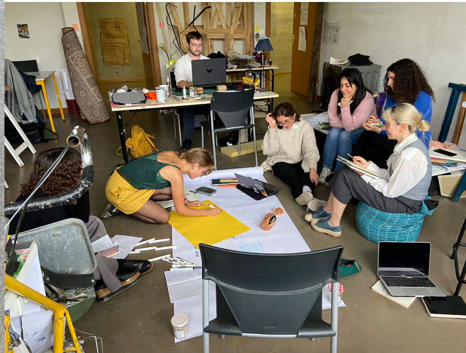
Travail d'atelier des étudiant-es octobre 2023