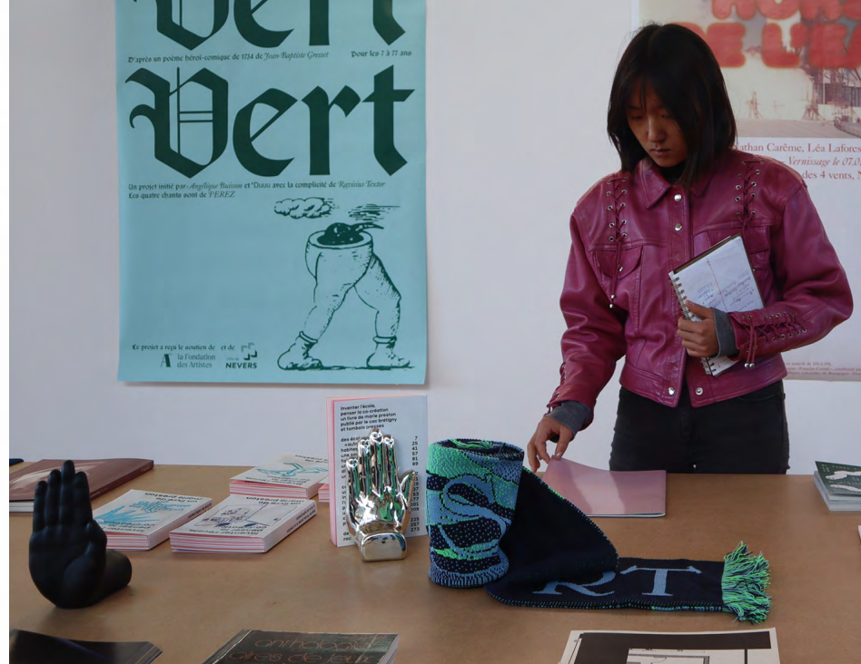
Exposition Tombolo Presses Impressions Multiples décembre 2023