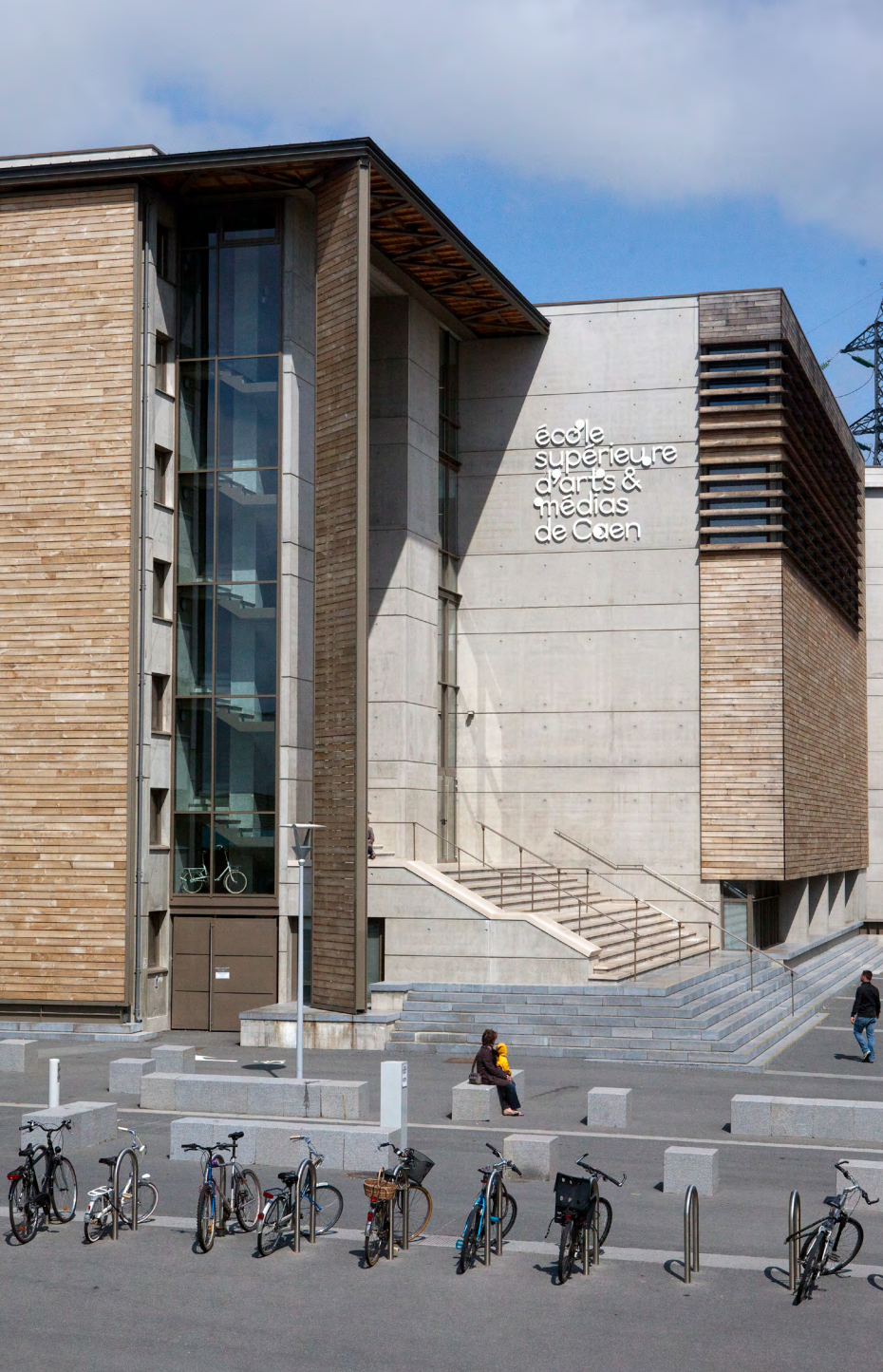
ésam Caen / Cherbourg site de Caen