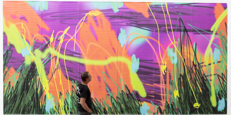
Cassie Ringuet DNSEP option Art mention Art juin 2023