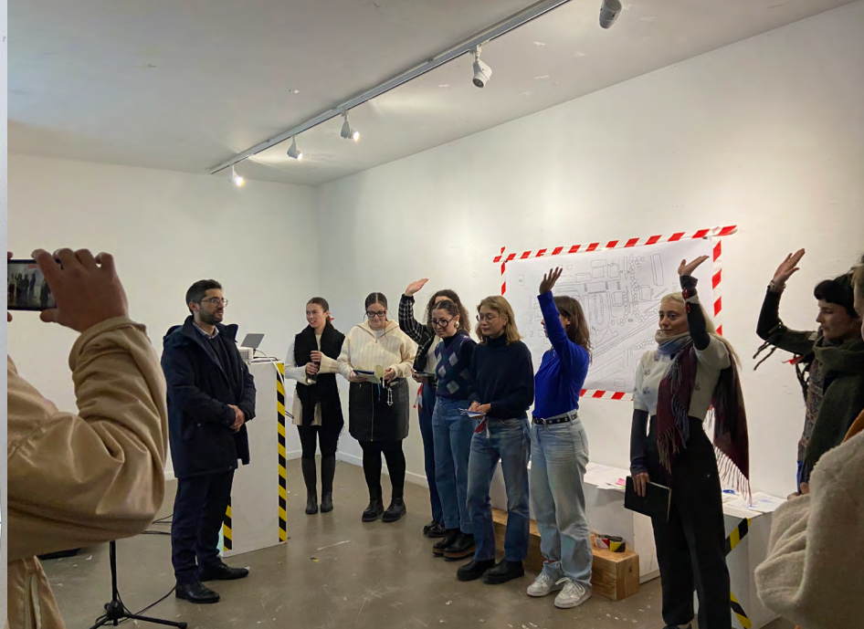
Présentation des projets aux élu·es de la Ville des Mureaux novembre 2023