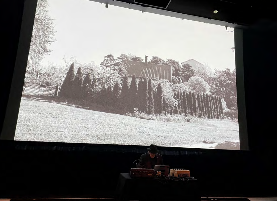
Concerts de Carl Michael Von Hausswolff Label CC / festival ]interstice[ mai 2023