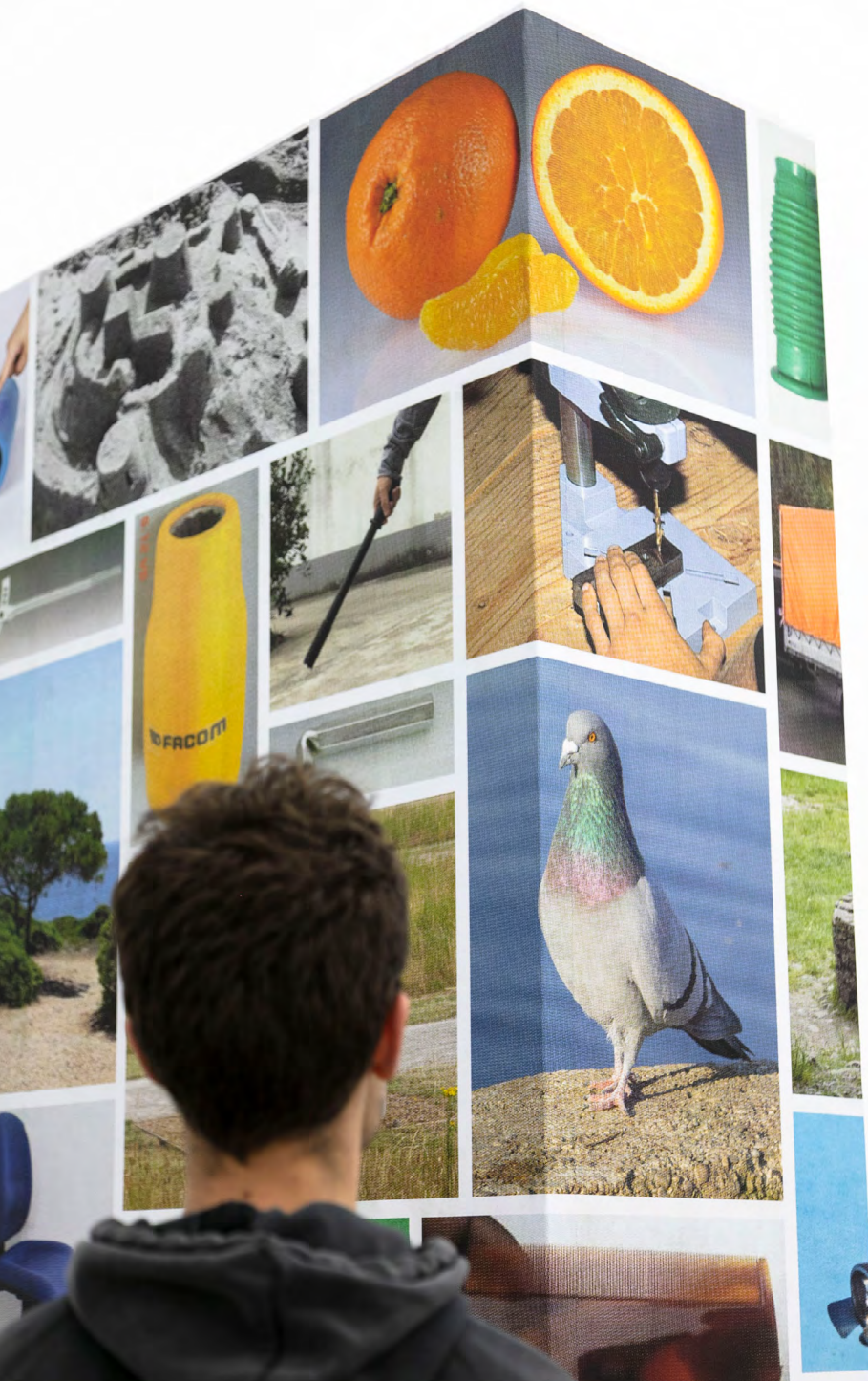
Charlotte Willaume DNSEP option Design mention Éditions juin 2022