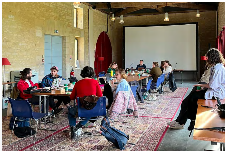
Workshop Speed Writing Fast Publishing IMEC, Saint-Germain la Blanche Herbe mars 2024