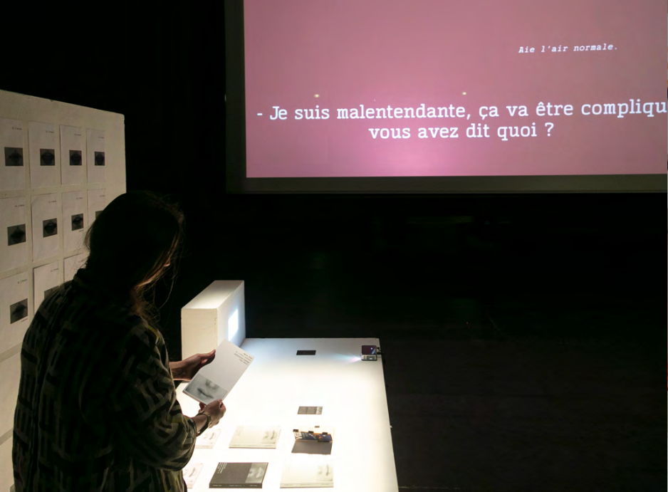
Fleur Mautuit DNSEP option Design mention Éditions juin 2023