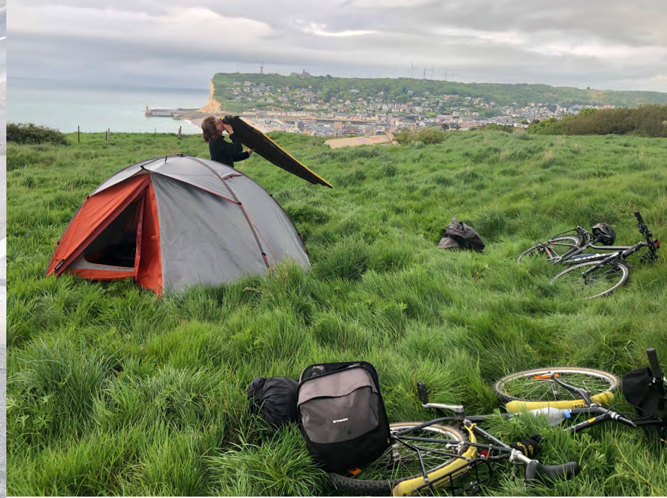
Trajet Caen-Bruxelles mai 2023