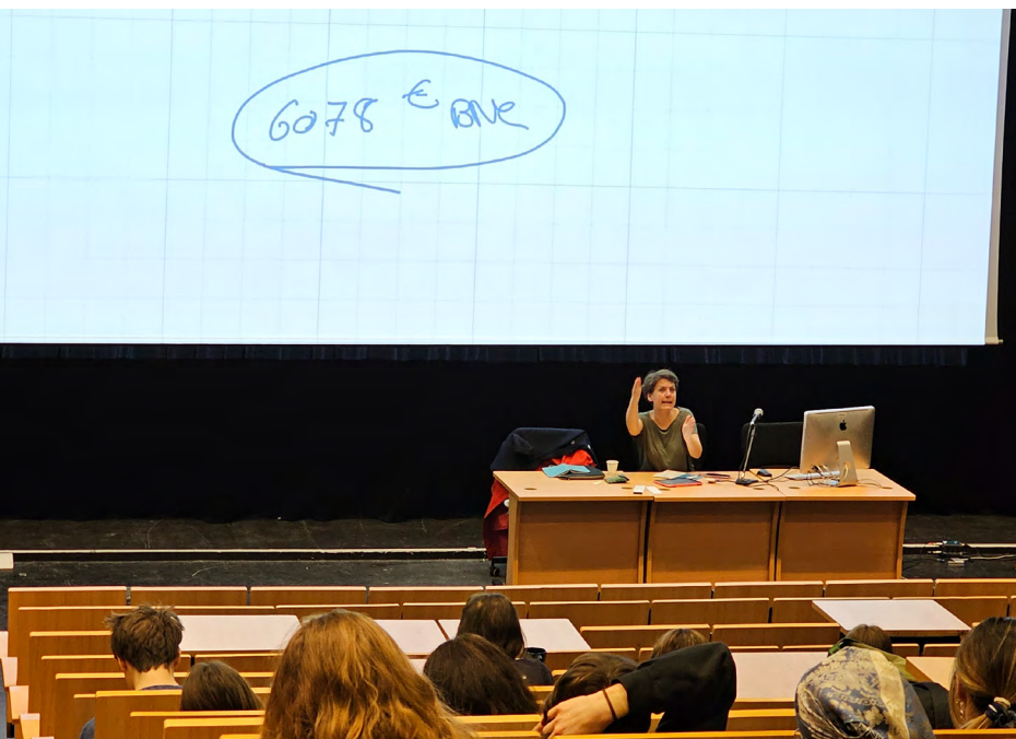
Conférence de l'agence de conseil et de formation maze module Connaissance de l'exercice professionnel janvier 2024