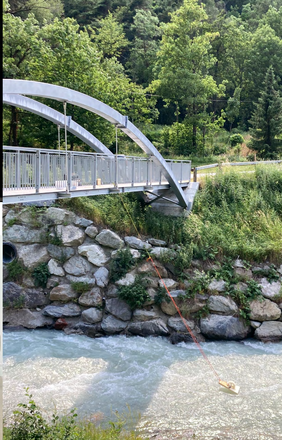
Salomé Coste-Bloch, Convergences des flux , œuvre réalisée lors du semestre d'études à l'École de design et haute école d'art du Valais (Sierre, Suisse), 2023