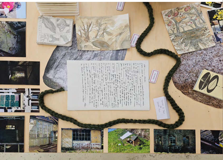
Rendu du workshop De Sève et de Plomb , présenté dans le cadre de l'exposition Nous sommes Orne , Le Pavillon, Caen mars 2024